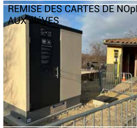
REMISE DES CARTES DE NOPEL AUX ÉLÈVES