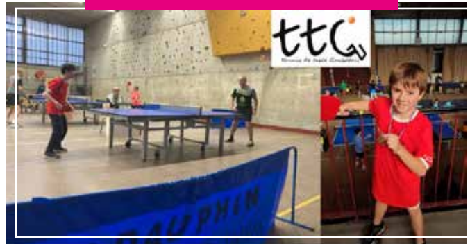
Simon championnat D3

Le club en pleine expansion ne compte pas en rester là et 2025 devrait voir arriver entre autres un robot lanceur de balles.