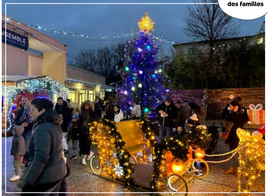
La grande fête des enfants et des familles