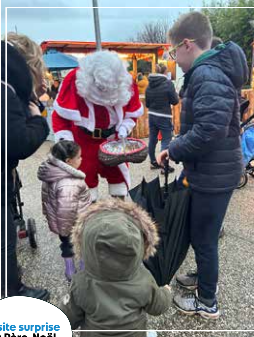
Visite surprise du Père-Noël, Oh Oh Oh !